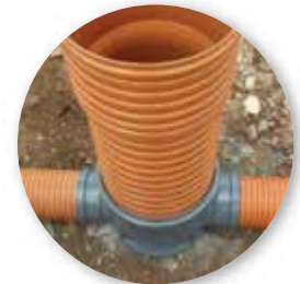
TUBERÍA CORRUGADA Adequa® SANEACOR