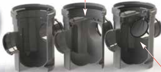
REGISTRO SIFÓNICA ANTI-RETORNO

El cuerpo de la arqueta está fabricado en PP y se compone de caras en su contorno para dar una mayor rigidez al conjunto así como de hendiduras para rellenar y compactar con hormigón o arena.